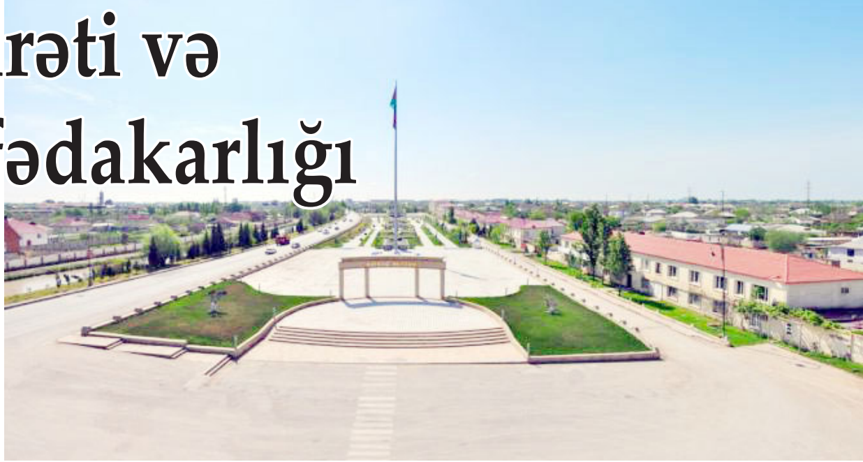
Təhsilə, səhiyyəyə, mədəniyyətə qayğı artırılıb

İki-üç gün əvvəl inkişaf edir. Bakı-Astara yolu ilə Salyan rayonuna tərəf gedirdim. Rayon mərkəzinə çatanda, Kürün üzərindəki böyük körpüdə keçən zaman qeyri-ixtiyari olaraq, çayın sularına nəzər yetirdim. Keçən qızmar çağında belə çayda suyun bol olduğunu gördüm sevindim.